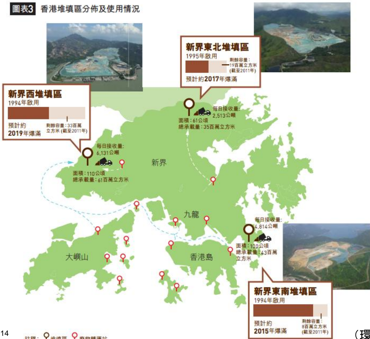
圖表3 香港堆填區分佈及使用情況